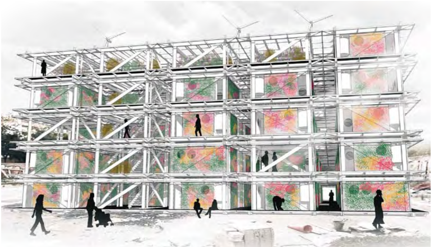
Pläne einer Wohnboxsiedlung, Guillermo Daviu