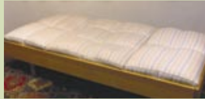
Ur-Dinkelspreu-Matratten: Liegen wie im Sand, nur weicher

Maximale Leistungsfähigkeit und Wohlbefinden setzen Gesundheit voraus, die ihrerseits gepflegt werden muss. Dazu gehört der tiefe Schlaf. Er wird gefördert durch kieselsäurehaltige Ur-Dinkelspreumatratten mit speziell gesteppten Kissen.