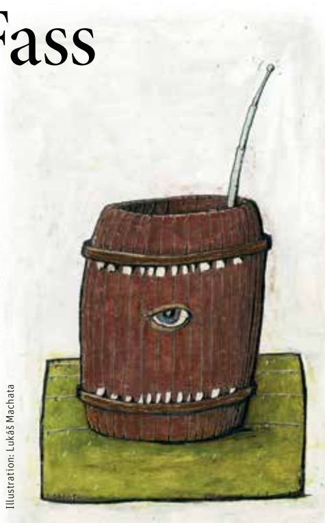
Illustration: Lukáš Machata

Konsequent, wie Diogenes nun einmal war, führte er ein äusserst einfaches Leben und lebte in einem Fass! Je älter ich werde, desto sicherer bin ich, dass ich in absehbarer Zeit selbst ins Fass umziehen werde, um nie mehr einer geordneten Arbeit nachzugehen, Rechnungen zu bezahlen, mir Sorgen über steigende Fixkosten zu machen, Parkbussen zu bezahlen, Steuererklärungen auszufüllen, Reiseannulationsversicherungen abzuschliessen, Boiler zu entkalken, Autos prüfbereit zu stellen, Abgastests zu veranlassen, von Telefonumfragen belästigt zu werden, (Atom-)Stromrechnungen zu bezahlen, TV-Urheberrechts-Gebühren zu zahlen, obwohl ich eh nie TV schaue, oder ein Smartphone, das sich selbst aufhängt, in das Fachgeschäft zu bringen, um vom Verkäufer zu hören: «Dieses Smartphone hat sich selbst